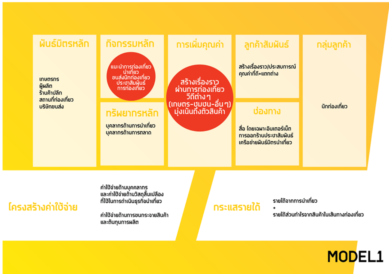
รูปที่ 4 ตัวอย่างการทำแบบจำลองธุรกิจ-ธุรกิจท่องเที่ยว