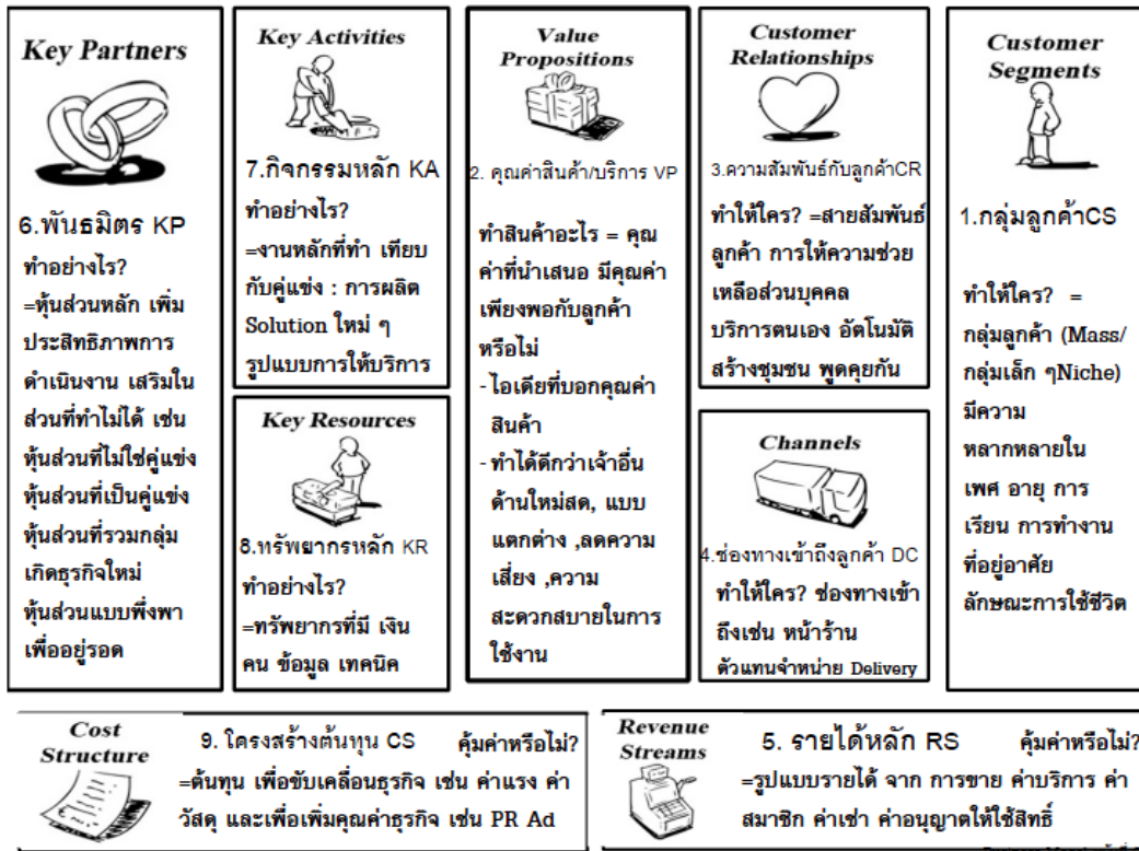
รูปที่ 3 ตัวอย่างการทำแบบจำลองธุรกิจ