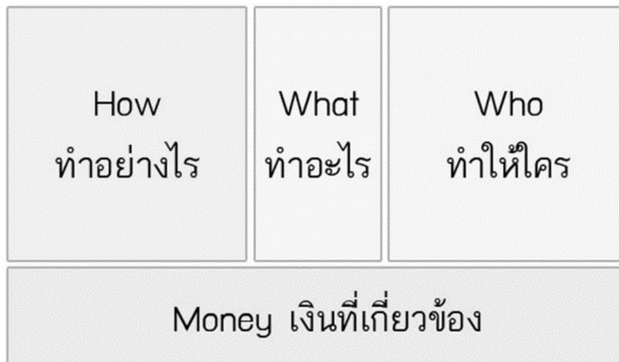
รูปที่ 2 แบบจำลองธุรกิจ

โดยหน้าตาของแบบจำลองธุรกิจ หรือ Business Model Canvas จะเป็นเทมเพลตสี่เหลี่ยมพื้นผ้า แบ่งหัวข้อหลักออกเป็น 9 ช่อง ซึ่งในแต่ละช่องจะช่วยให้เรามองเห็นรายละเอียดในธุรกิจของตัวเอง รวมทั้ง จุดเด่นจุดด้อย และที่สำคัญ Business Model Canvas จะช่วยให้ทีมของเรามองเห็นภาพรวมของธุรกิจใน ทิศทางเดียวกัน เราจะรับรู้และเข้าใจได้พร้อมๆกันว่า ตอนนี้ปัญหาคืออะไร ตรงไหนต้องลด ตรงไหนต้องเพิ่ม การ brainstorm จะไม่สะเปะสะปะหรือลงประเด็น เมื่อมองเห็นภาพใหญ่ของแบบจำลองธุรกิจแล้ว นำทั้ง 9 หัวข้อออกมาจำแนกตามประเภทตาม 4 ช่องด้านล่าง ซึ่งแต่ละส่วนจะมีหน้าที่หลักแตกต่างกันไป