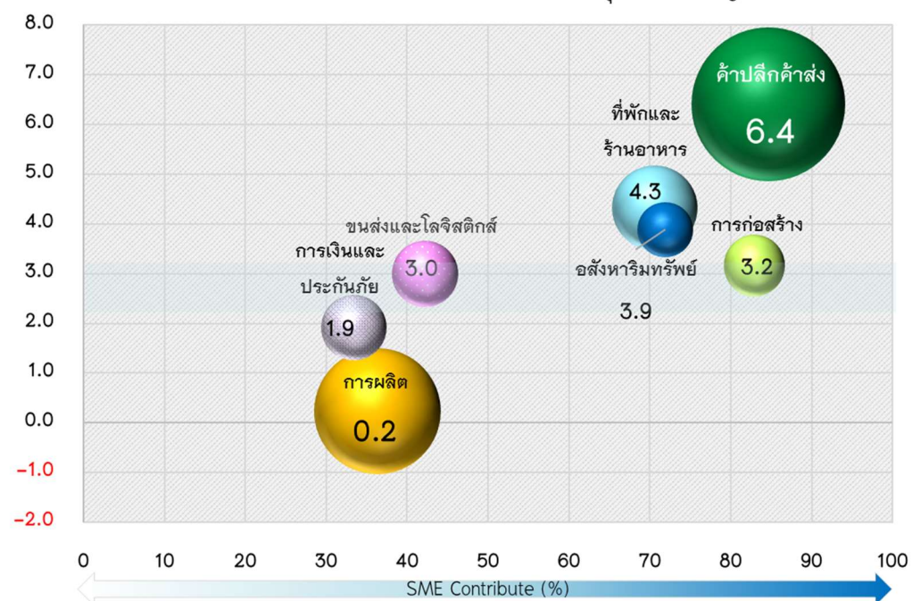
Growth% GDP SME ในช่วงครึ่งแรกของปี 2562 ในสาขาธุรกิจที่สำคัญของ SME

สำหรับภาพรวมการเติบโตของ GDP SME ในครึ่งแรกของปี 2562 แม้ว่า GDP SME จะมีแนวโน้มชะลอตัวลงอย่างต่อเนื่องตั้งแต่ไตรมาสแรกของปี แต่ยังคงขยายตัวได้สูงกว่าการขยายตัวของเศรษฐกิจในภาพรวมทั้งประเทศ โดยพบว่าสาขาธุรกิจที่ SME มีบทบาทสูง เช่น ธุรกิจค้าปลีกค้าส่ง ธุรกิจบริการที่พักและร้านอาหาร ธุรกิจก่อสร้าง และธุรกิจบริการด้านอสังหาริมทรัพย์ ยังคงขยายตัวได้สูงกว่าภาพรวม